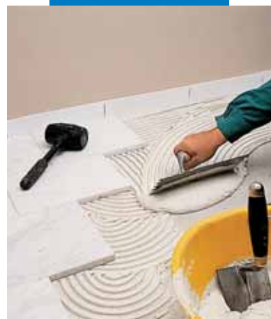
Укладка белого каррарского мрамора с помощью серого Granirapid