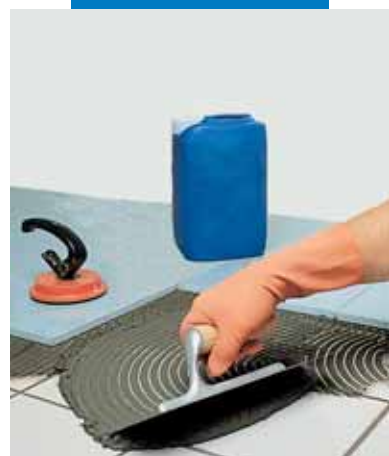
Укладка агломерата поверх имевшейся керамической плитки с использованием серого Granirapid